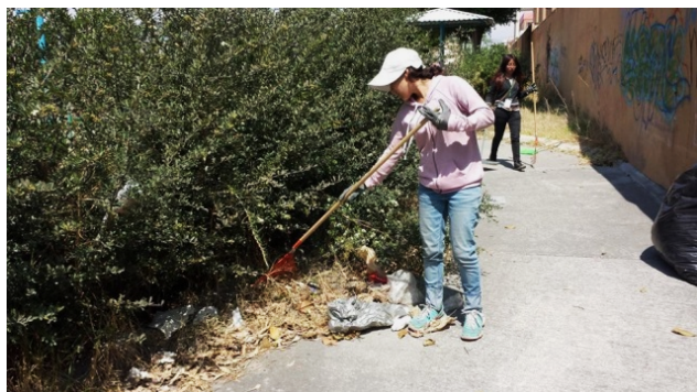
Figura 6. Parque de la 119. Trabajos de limpieza y poda del parque.