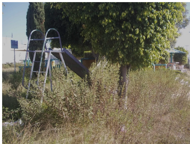
Figura 8. ¿Dónde jugarán los niños? Condiciones iniciales del parque de la Guardería.

Por otra parte, la ubicación del parque de la 119, rodeado de casas, ayudó a que la respuesta inicial de los vecinos fuera de mayor participación. No fue así con el parque de la guardería, donde la proximidad con la iglesia y la guardería hace que la gente solo pase por este parque y no sea parte de su actividad cotidiana.