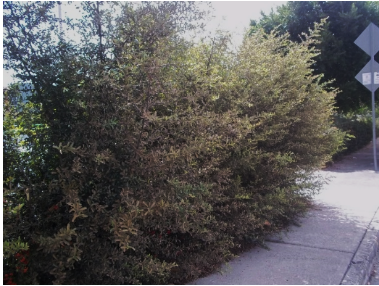
Figura 3. Condiciones de abandono y deterioro en los parques. Arbustos circundantes del parque tapan la vista al interior.