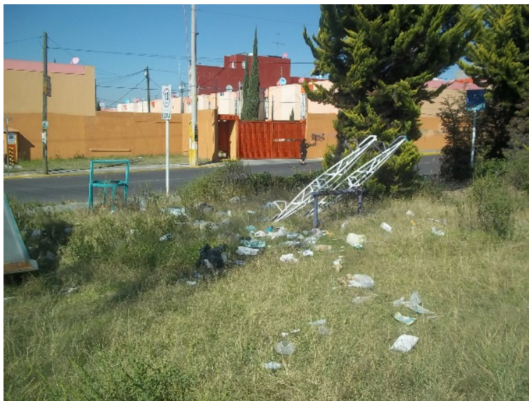
Figura 4. Condiciones de abandono y deterioro en los parques. La basura en los parques afecta las condiciones de salubridad.