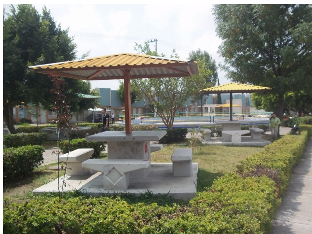
Figura 7. Resultados en el parque de la 119. El cambio es significativo, y la gente transita por el parque.

Wilson y Kelling (2006) y Averdijk (2011), mencionan que las condiciones de un espacio determinan el uso que de él se haga. En este sentido, el cambio en la imagen del parque (figura 7) fue radical por lo que empezó a ser usado de manera más continua e incluso en horarios nocturnos, pues los usuarios manifestaron sentirse más seguros.