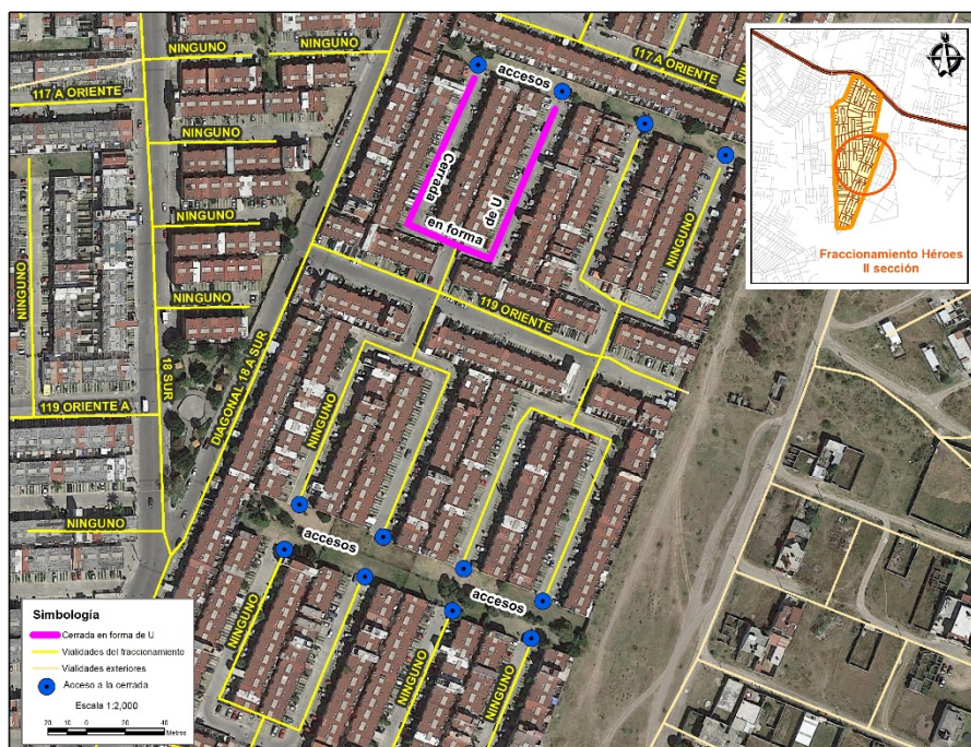
Figura 2. Ejemplo de cerradas.