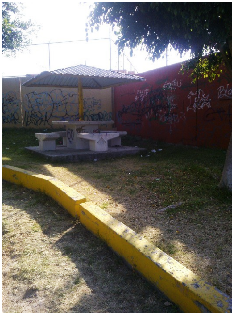
Figura 5. Condiciones de abandono y deterioro en los parques. El grafiti y la basura son constantes, prueba de que no hay vigilancia.